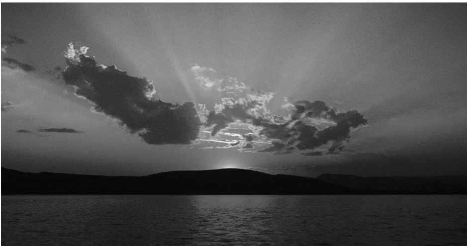
Uno dei tramonti che vogliamo goderci in spiaggia al soggiorno ...